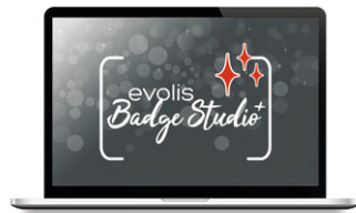
Evolis Badge Studio® Kartendesign-software